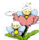
圖 5：「和昆蟲做朋友」教學模組網頁示例